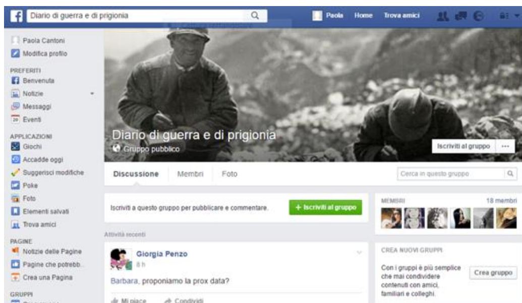
Figura 1: Home della pagina Facebook del progetto

L'approccio al testo, già informato ai criteri rispettosi dell'originale indicati dalle docenti, si è ulteriormente definito nella volontà esplicita degli studenti di ricercare le intenzioni dello scrivente e di rappresentarle al meglio (nel lavoro individuale e in plenaria, per cui cfr. quanto descritto nel § 2.3), di mettersi nei suoi panni per far rivivere il suo testo, operazione linguistica che ha coinciso con una più profonda esperienza conoscitiva e formativa fondata anche su questa operazione di immedesimazione.