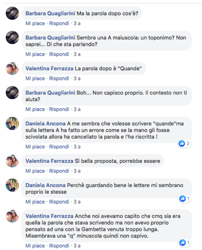
Figura 4: Pagina Facebook del progetto: risposte su parola cancellata

Nel corso del lavoro in plenaria sono invece emersi da parte di tutti curiosità e desiderio di approfondimento sui luoghi dei combattimenti (anche se nei manuali di storia non mancano cartine dettagliate, gli studenti solitamente le ignorano), sdegno e rabbia nell'apprendere quanti giovani soldati fossero stati uccisi da altrettanto giovani ufficiali il cui compito era appunto imporre una disciplina che vacillava davanti a scelte tattiche e strategiche folli, commozione e pena nel sentire dalla viva voce di un loro coetaneo le indicibili sofferenze della trincea e della prigionia 49 .