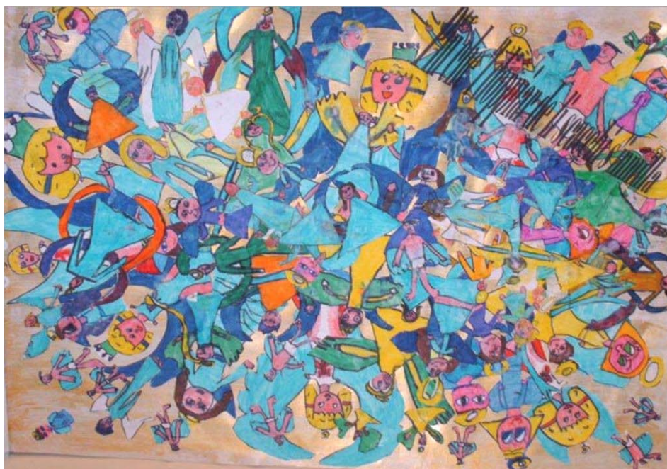
Figura 2: Tavola illustrata realizzata dai bambini dell'Istituto Comprensivo "Montecarlo"

la poesia di Dante ti fa vedere le cose sotto gli occhi della fantasia e, quindi, tu te le immagini, ti diverti a pensare come sarebbero, cosa faresti in quel momento, cosa decideresti se fossi in quella situazione e, quindi, la poesia ti fa sentire grande...grande dentro (Alunno 2).