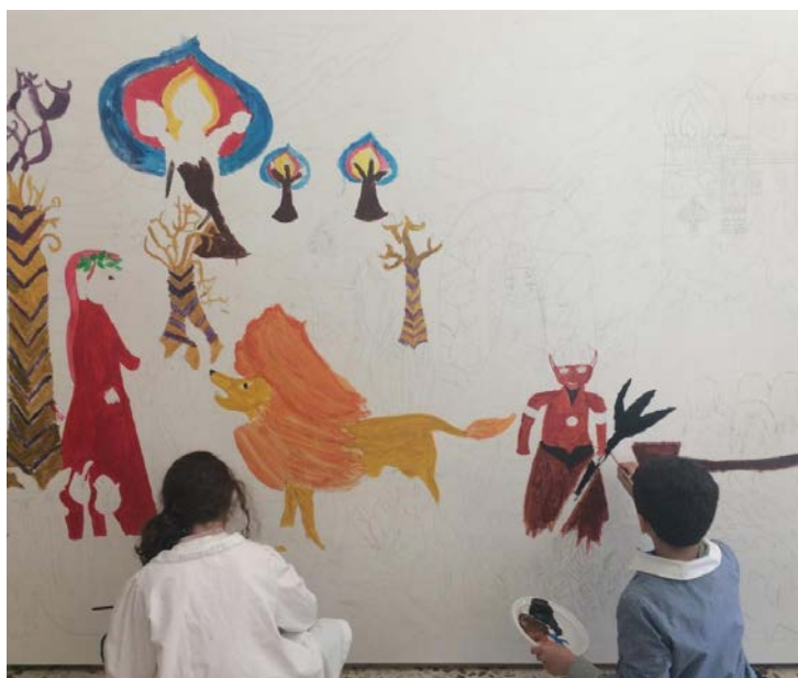
Figura 7: I bambini di Salbertrand dipingono la Divina Commedia