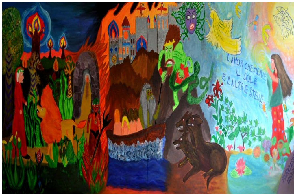
Figura 8: Il murale realizzato dai bambini della Scuola Primaria di Salbertrand