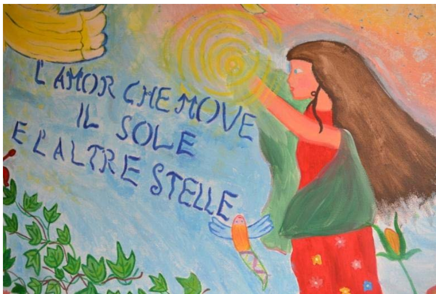
Figura 5: L'analisi e lo studio dei versi danteschi nella Scuola Primaria di Salbertrand

La prima parte del progetto è stata dedicata alla lettura, all'analisi e allo studio di alcune terzine. In questa occasione ho visto negli occhi dei miei piccoli alunni una forte emozione: i versi di Dante hanno parlato alla fantasia dei bambini, hanno stimolato profondamente la loro curiosità e il loro desiderio di conoscenza (fig. 5) 6 .