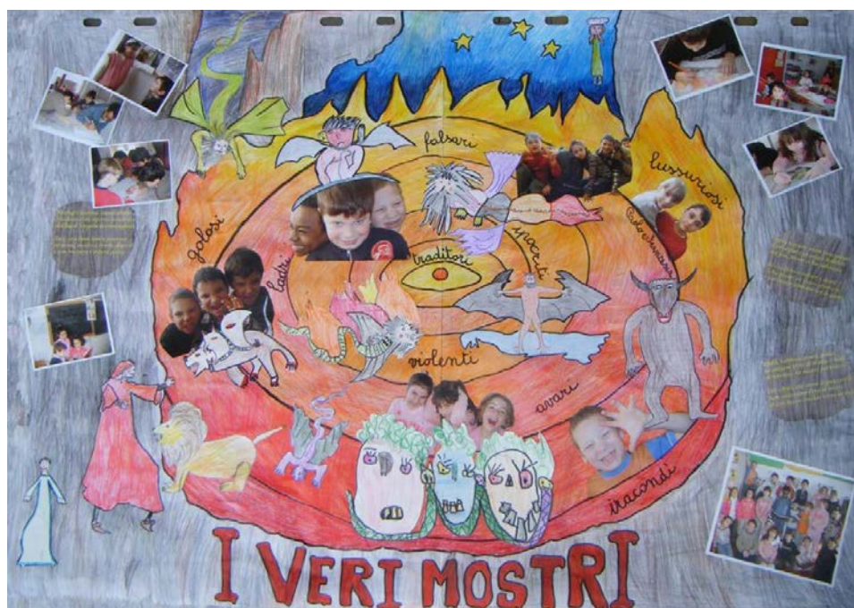
Figura 1: Cartellone realizzato dai bambini della Scuola Primaria "Fratelli Pagliero"

Il progetto, oltre ad aver riscosso un grande successo tra gli allievi, ha vinto il primo premio al concorso, riconoscimento che la Commissione giudicatrice nazionale, presieduta da Francesco Sabatini, ha conferito ex aequo anche all'Istituto Comprensivo "Montecarlo" di Lucca, per l'originalità di impostazione, la ricchezza di dati, l'attiva partecipazione degli alunni e l'appropriata regia dei docenti (cfr. MIUR 2008).