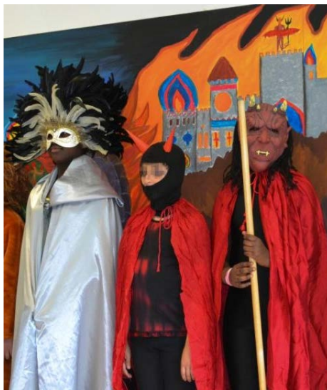
Figura 6: I bambini di Salbertrand recitano la Divina Commedia